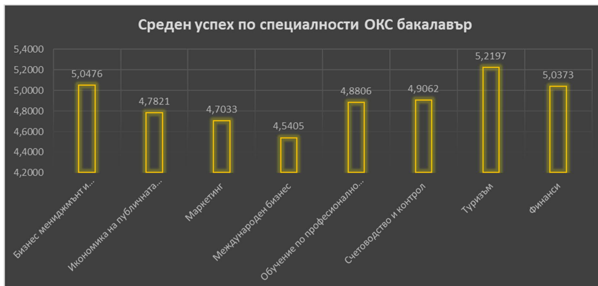
Графика 1: Среден успех ОКС Бакалавър за учебната 2019/2020

Данните за средния успех на студентите в ОКС „Магистър“ през учебната 2019/2020 г. показват, че той варира между различните специалности и етапи на обучение. За студентите от първи курс в ОКС Магистър (неспециалист), средният успех от редовна и задочна форма на обучение варира между Много добър 4.9420 и Отличен 6.00. За студентите ОКС Магистър (неспециалист) отчитаме повишение в общия среден успех. Запазва се тенденция, средният успех на студентите от задочните форми на обучение да надвишава този на студентите, обучаващи се в редовна форма на обучение. Когато се разглеждат резултатите за средния успех на студентите в ОКС „Магистър“ може да се направи извод, че този на студентите в съвместните специалности е малко по-висок от този на студентите в останалите специалности. Обяснение за тези резултати би могло да се търси в интензивната работа в малки групи от високо мотивирани студенти, които имат конкретен опит и интереси в практиката. Почти всички от тях работят в областта, в която следват, докато “конвенционалните” специалности са предпочитани от студенти, които продължават обучението си в ОКС „Магистър“ непосредствено след завършване на ОКС „Бакалавър“, което в редица случаи съвпада и със старта на трудовата им дейност.