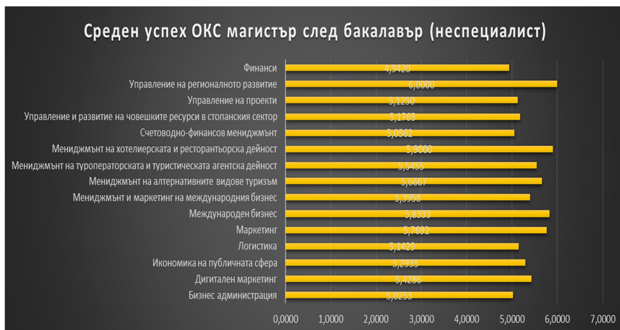
Графика 2: Среден успех на студентите, обучаващи се в ОКС Магистър след ОКС Бакалавър (неспециалист)